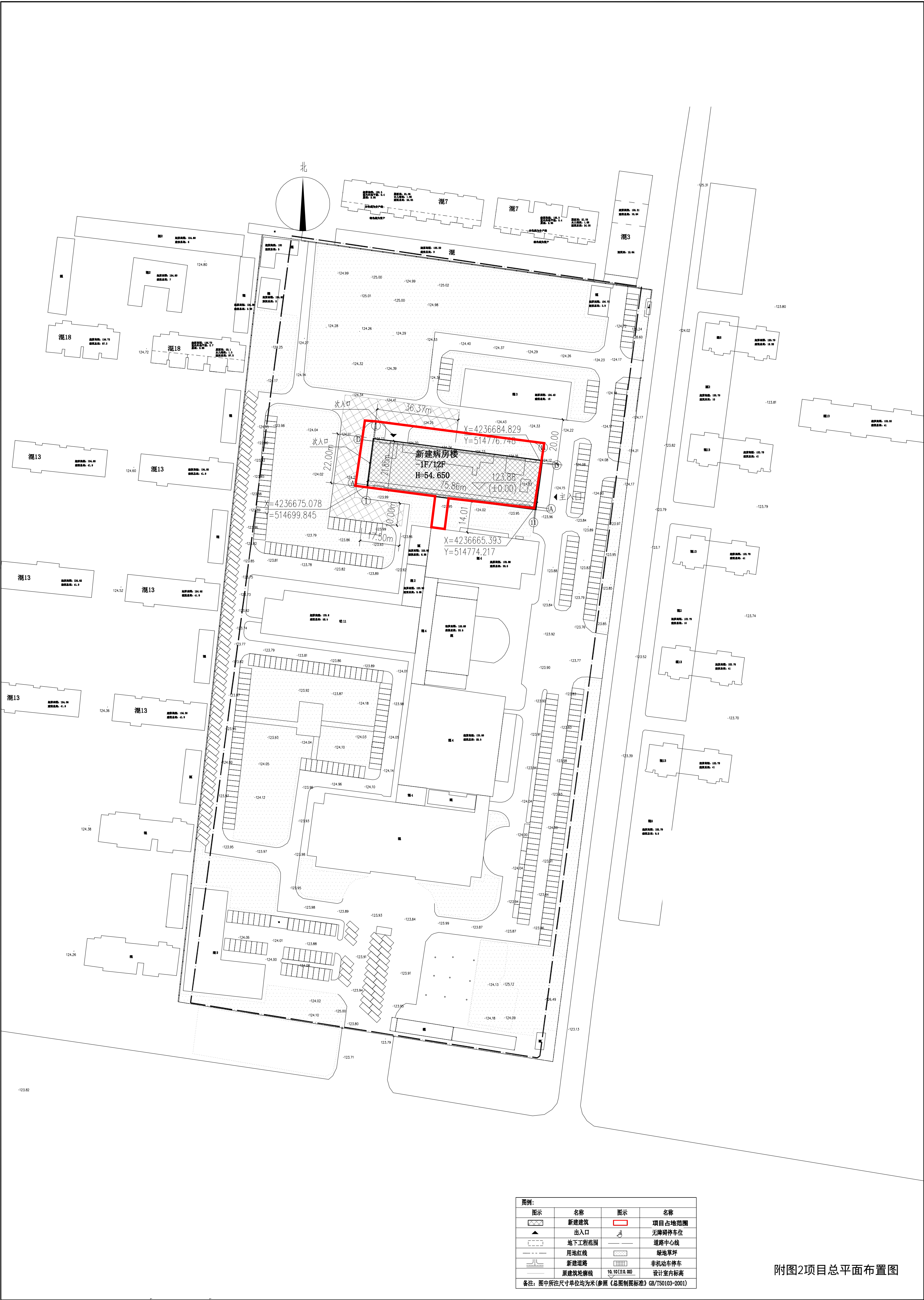
附图2项目总平面布置图