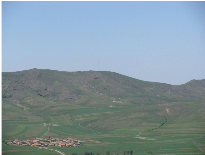
图 1-2 项目区地形地貌

项目区属东亚大陆性季风气候中温带亚干旱气候。其特点是春秋多风，冬季漫长干寒；夏季短促凉爽。昼夜温差悬殊。根据沽源县气象站的气象资料可知，多年平均气温 1.4℃左右，多年极端最高气温为 34.5℃，极端最低气温为-39.9℃；标准冻深 2.25m，最大冻土深度 2.80m；年平均日照时数 2941h，大于等于 10℃积温 1801℃。年均蒸发量 1659.4mm，4-6 月最大，可达 792.6 mm，占总量的 48%，年均相对湿度只有 61%。无霜期 95 天左右，早霜始于九月十八日，晚霜于六月十九日结束。