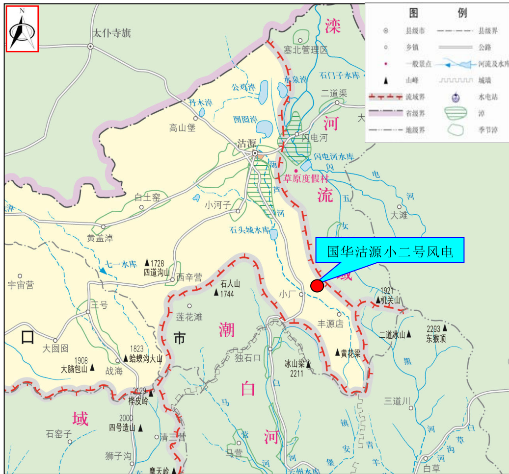
图 1-3 项目区水系图

国华沽源小二号风电场属于张家口内陆河流域，位于石头城水库上游，河谷宽阔，风电场位于山顶部位，距主河道较远，基本不会影响河流水系。项目区水系图见图 1-3。