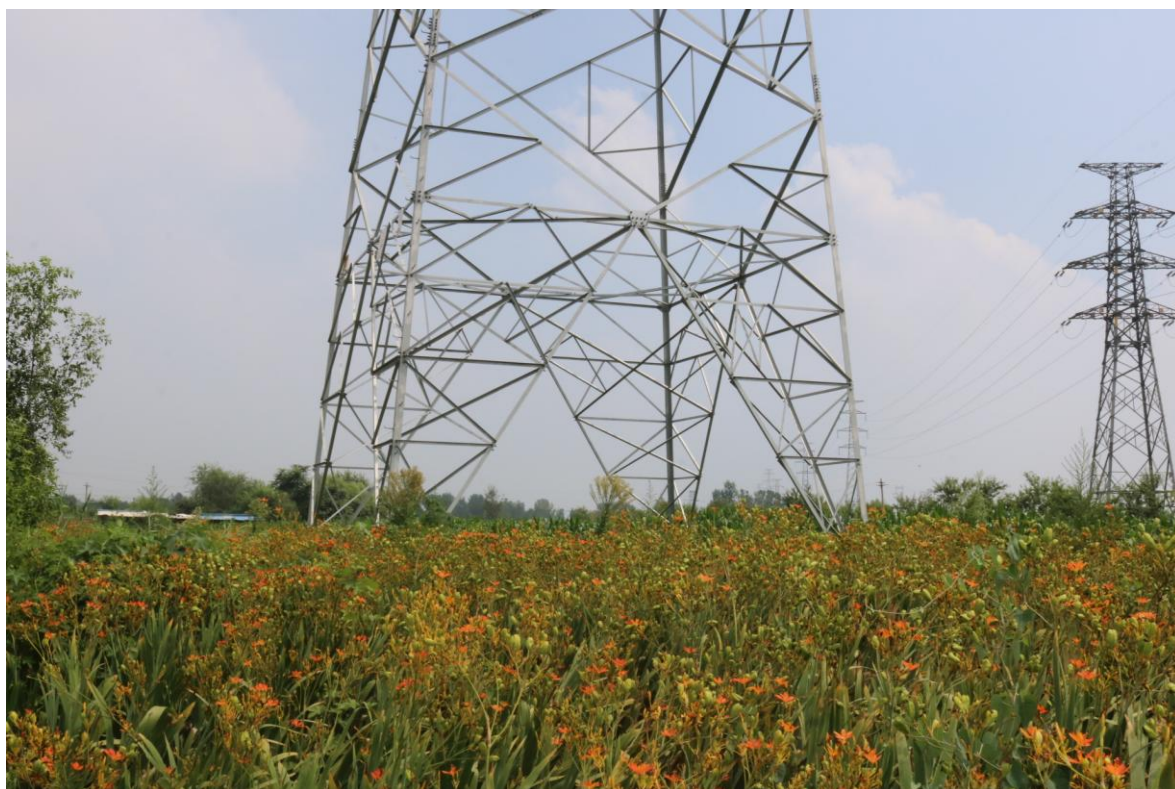
衡水—衡水牵引站 22 号塔基（2018 年 7 月）