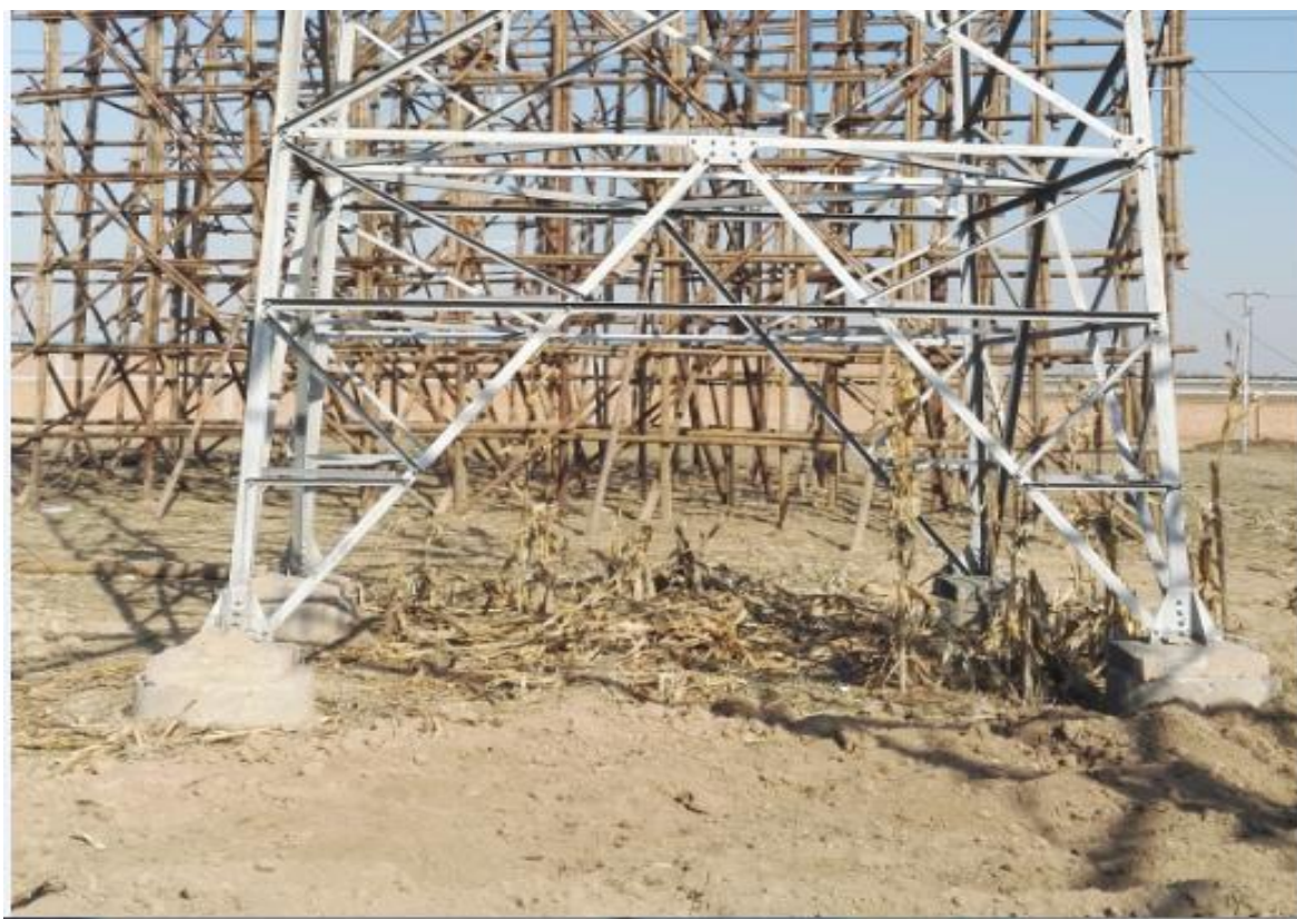
衡水牵引站—景县线路 4 号塔基（2017 年 11 月）