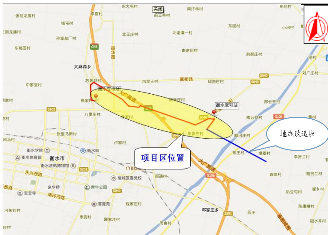
图 1-1 项目区地理位置图