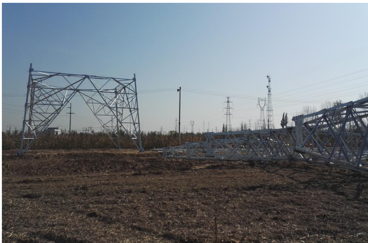
衡水—衡水牵引站线路塔基表土回铺（2017 年 11 月）