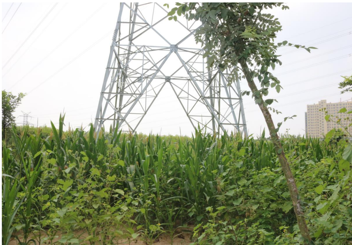
衡水—衡水牵引站 3 号塔基（2018 年 7 月）