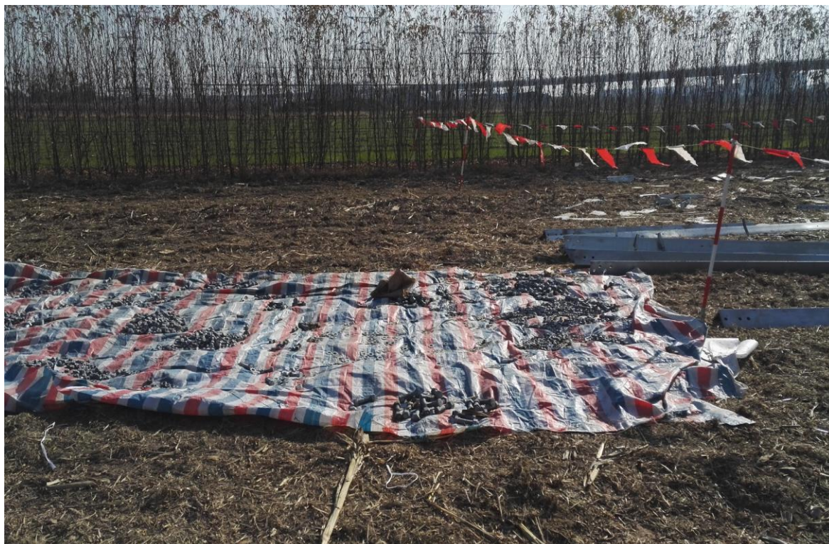
临时遮盖（2017 年 11 月）