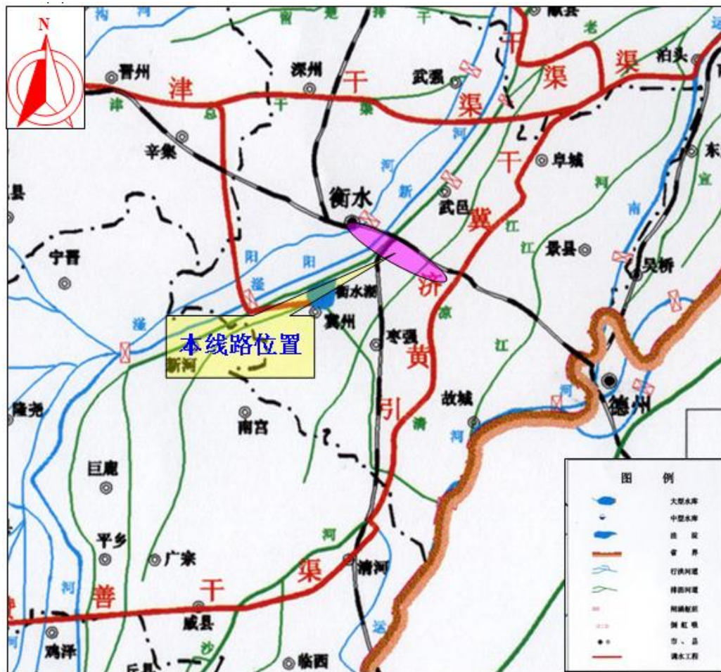
图 1-4 项目区水系图