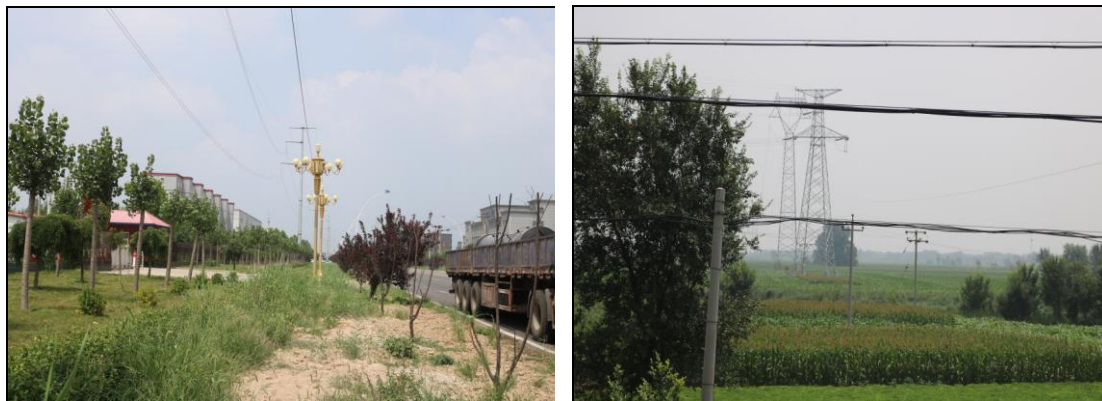
图 1-3 项目区植被

工程区域土壤主要为潮土，土壤质地偏轻、疏松，遇大风和集中雨水易发生土壤侵蚀。植被类型属温带落叶阔叶林，植物以常见的树种（杨、柳、刺槐等）以及农作物（玉米、小麦等）为主。项目区植被照片见图 1-3。