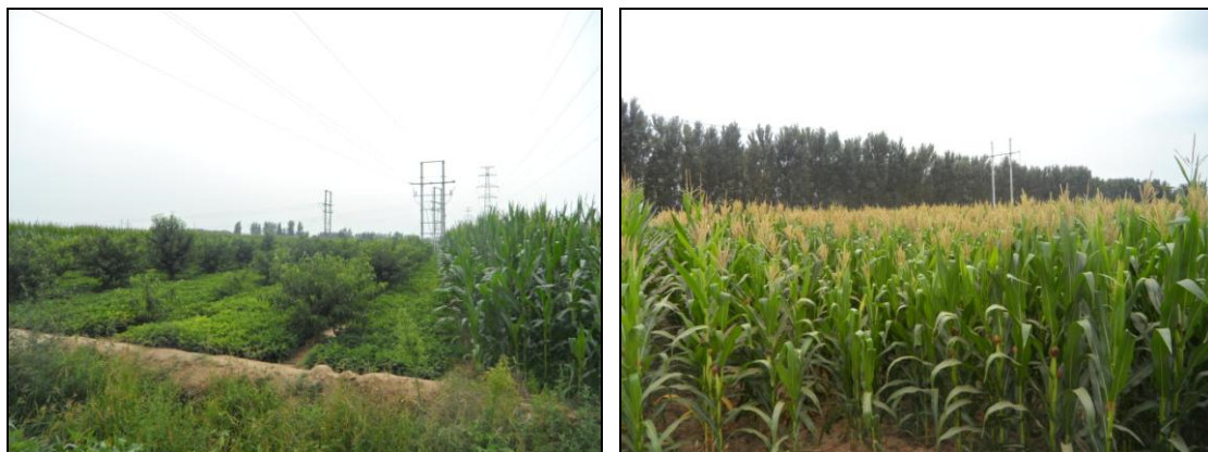
图 1-2 项目区地形

工程位于衡水市高新技术产业开发区、武邑县和景县境内，属平原地貌，地形平坦。地势由西北向东南微倾。区域内现状土地利用类型以耕地为主，工程附近无自然保护区、珍稀文物遗址等。项目区地貌类型见图 1-2。