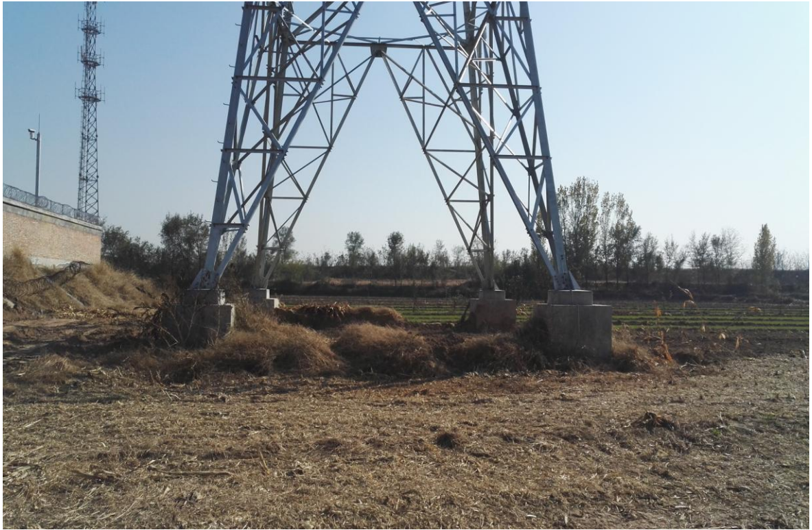
衡水牵引站外塔基（2018 年 7 月）