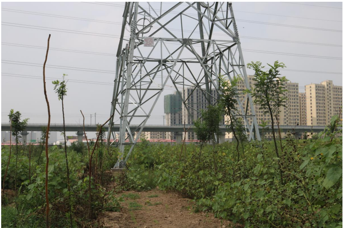
衡水站外塔基已复耕（2018 年 7 月）