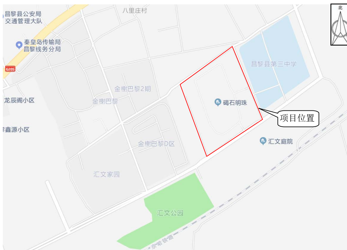
项目区地理位置图

碣石明珠项目位于河北省秦皇岛市昌黎县城东八里庄村南侧，规划碣石路东侧，汇文街北侧，中心位置地理坐标：东经119°11'55"，北纬39°43'12"，交通便利，配套设施齐备。