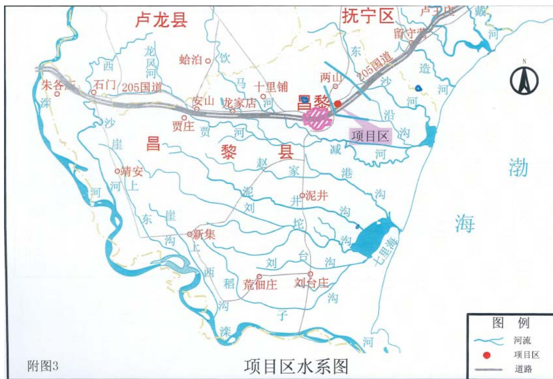
项目区河流水系图