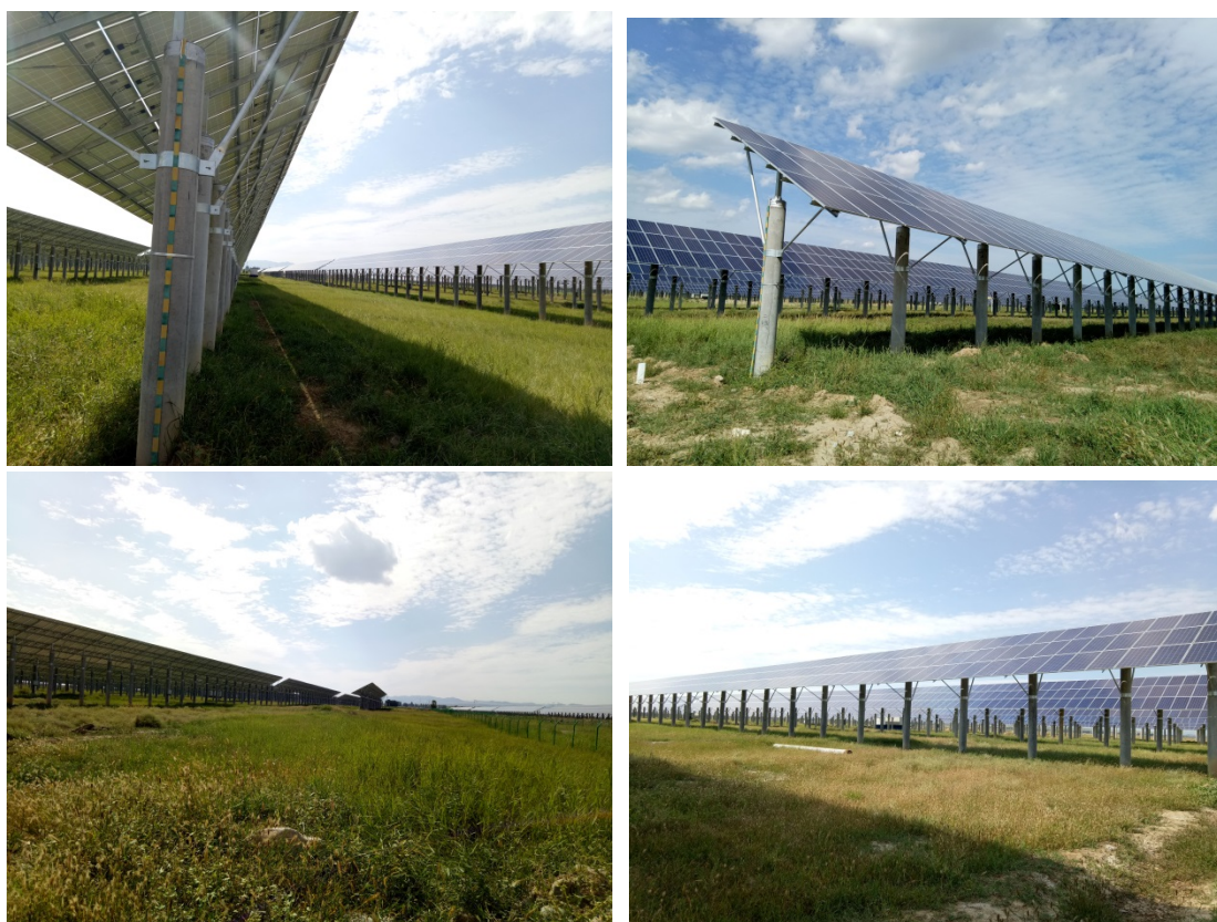
光伏发电区植被恢复情况