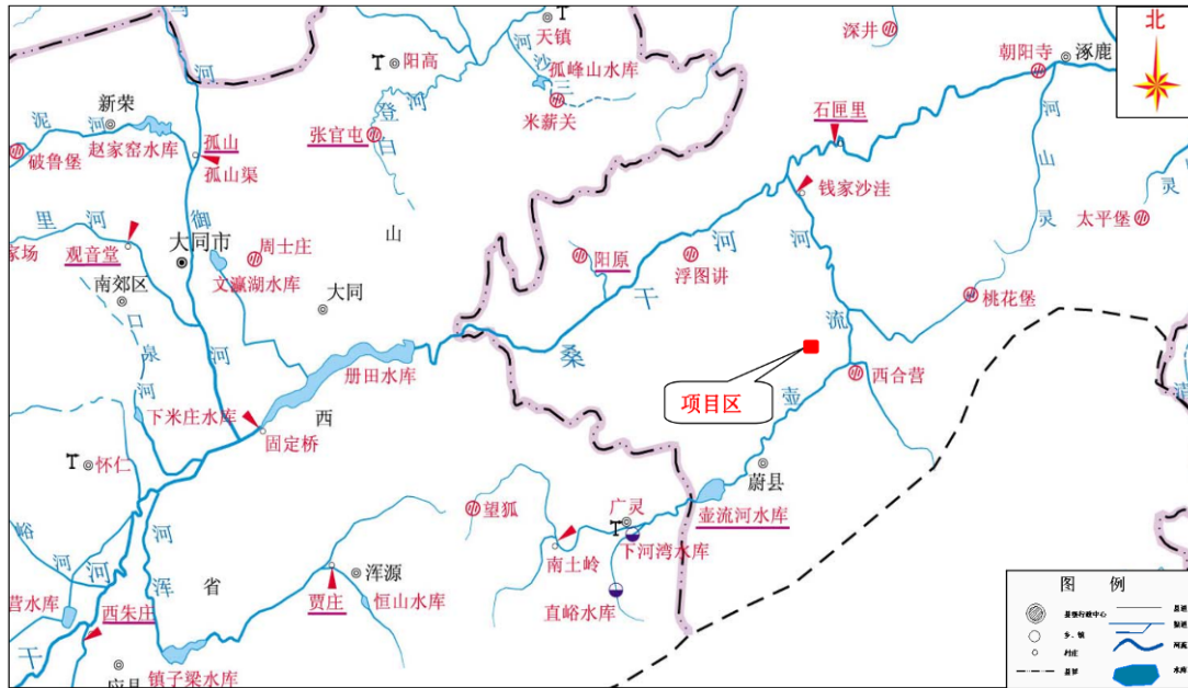
图1-2 项目区河流水系图