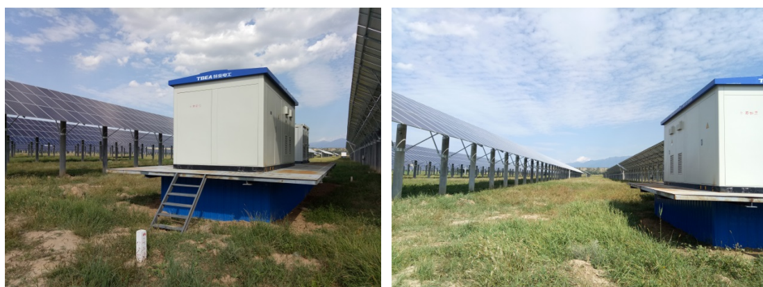
逆变升压区植被恢复情况