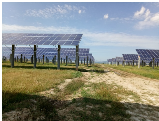
直埋电缆区植被恢复情况