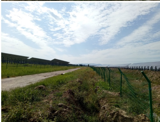
施工检修道路及土质排水沟情况